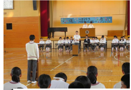
第1回生徒総会の様子